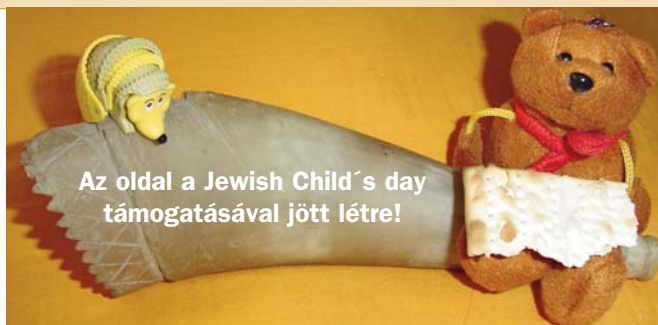
Az oldal a Jewish Child's day támogatásával jött létre!