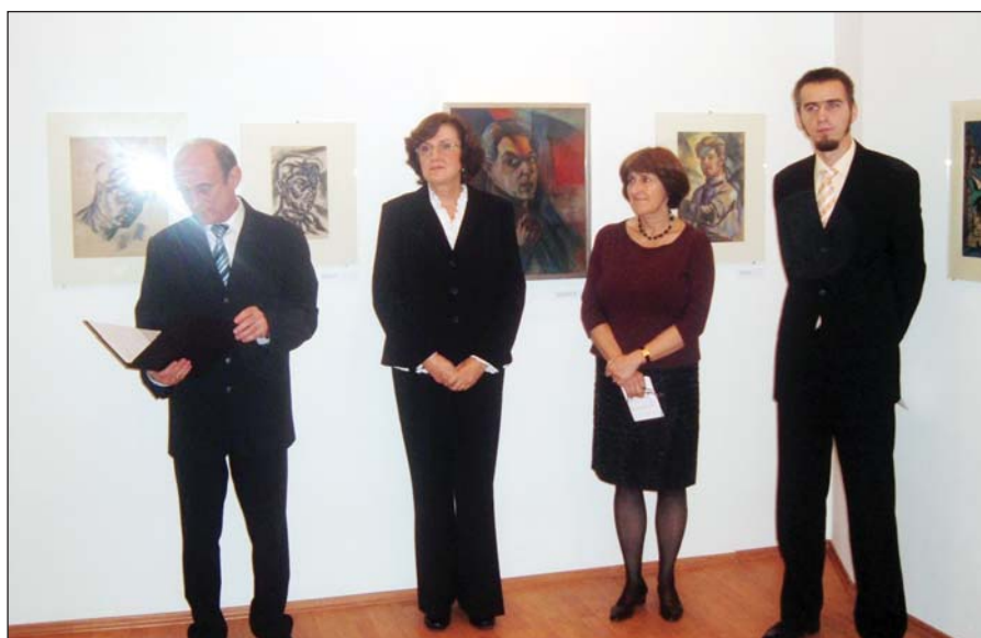
A megnyitó pillanatai