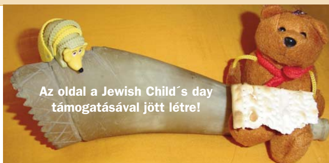
Az oldal a Jewish Child's day támogatásával jött létre!