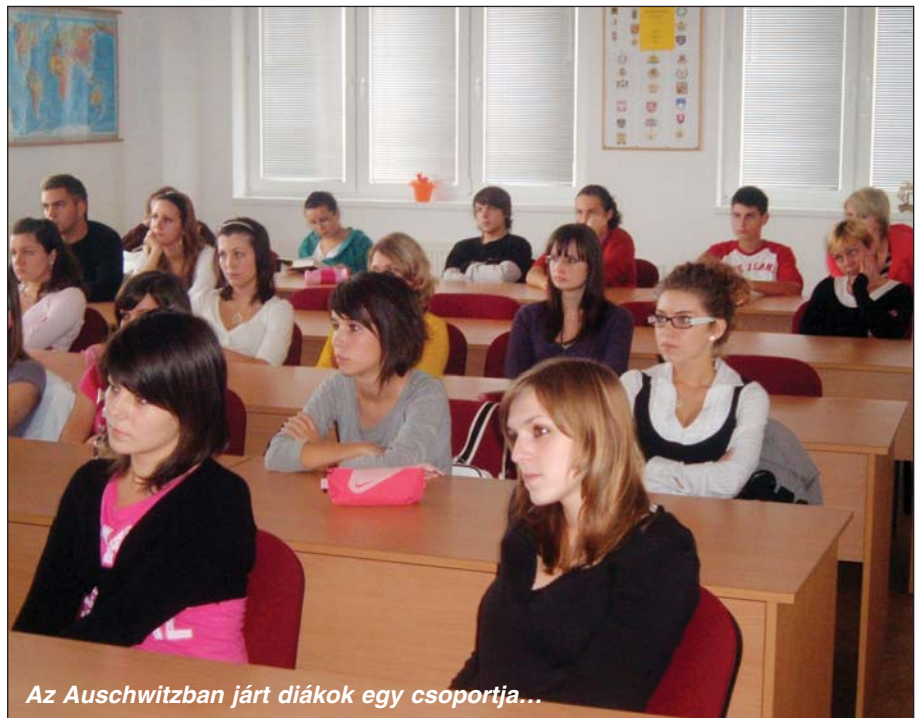
Az Auschwitzban járt diákok egy csoportja...

lokausz emlékműnél koszorúzással ért véget.