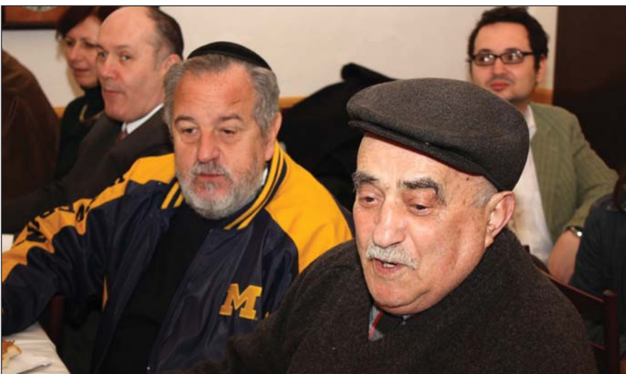
Együtt a körzet tagjaival...