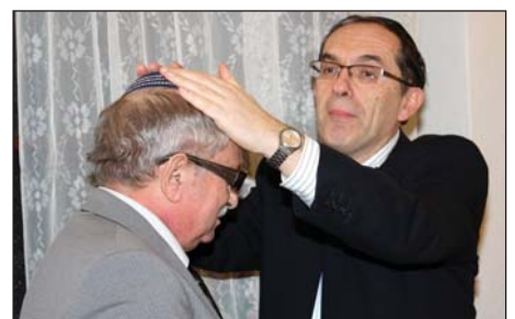
A rabbi áldása az ünnepeltre

★ A titkárság szabadság miatt december 18-tól január 4-ig zárva tart! Az első fogadónap 2009. január 5-én lesz.