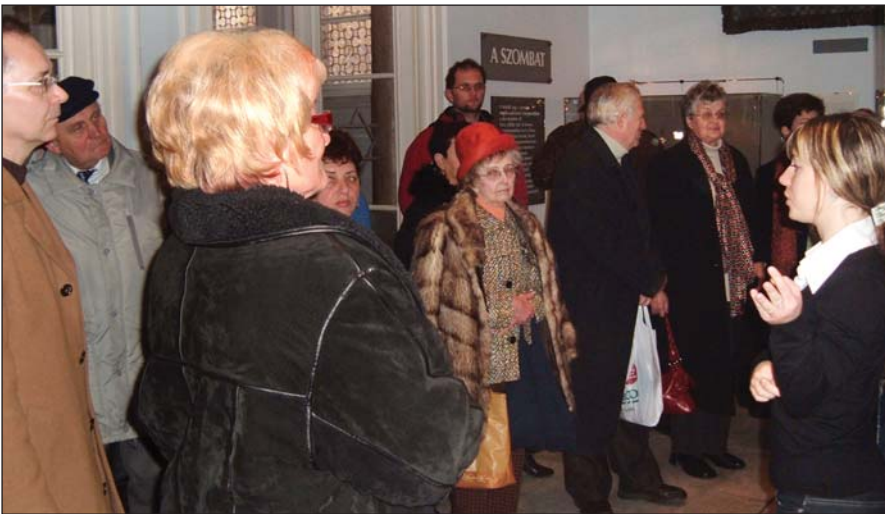
Látogatás a Zsidó Múzeumban