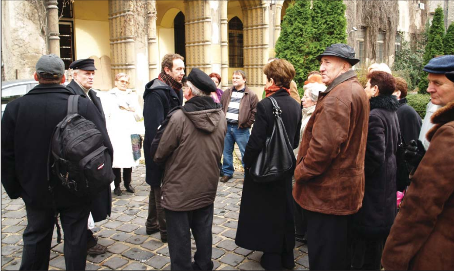
Csoportunk az emlékfánál, a zsinagóga udvarán