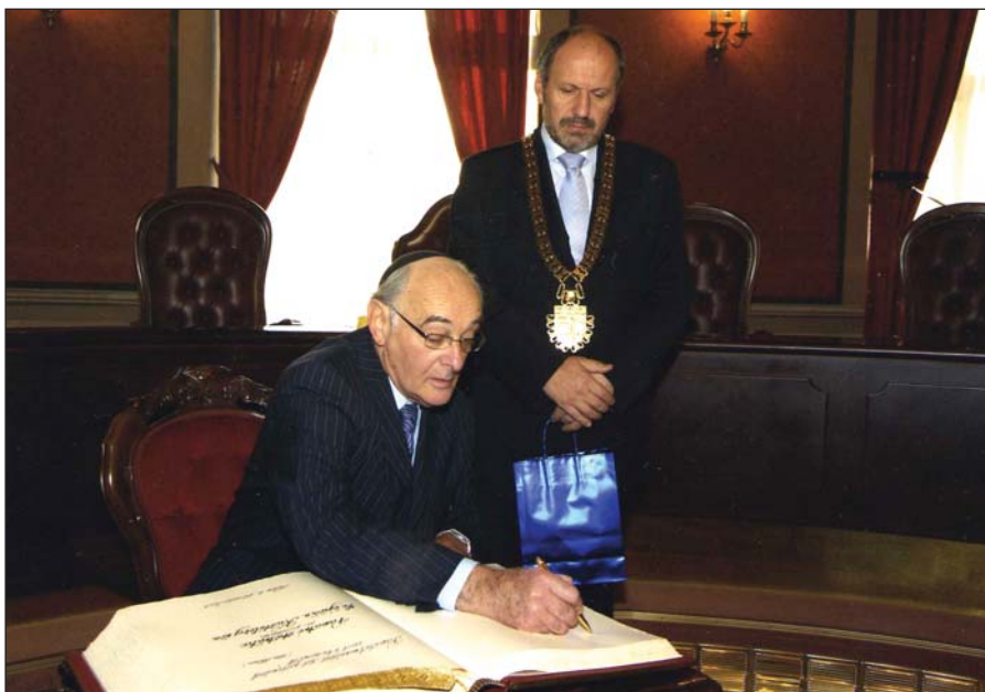
Fotka z recepcie ktorú usporiadal primator mesta Košíc pre preživších Šoa pri príležitosti 70-tého výročia „kristalovej noci“