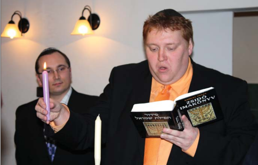
Chanuka első napja Komáromban