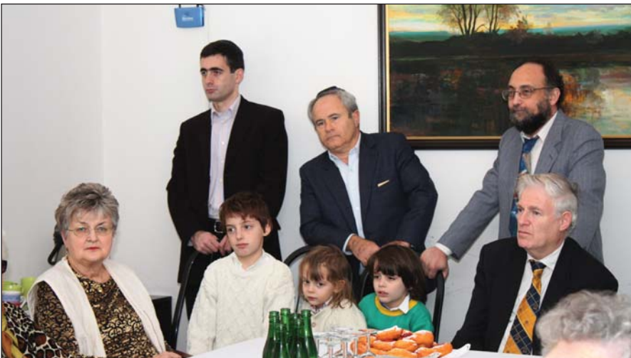
Kicsik és nagyok a chanukai fánk körül...