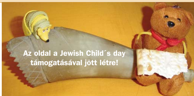
Az oldal a Jewish Child's day támogatásával jött létre!

Ha rajtam múlik, én mégis legszívesebben vissza-vissza utaznék az idők folyamán, és élnék abban a korban, amikor még minden nap bizonytalan volt, és csupán a saját leleményességére számíthatott a magunkfajta. Egyesek mindezt a bennem rejlő romantikus hajlamoknak tulajdonítják, ami szerintem részint igaz is. Csak a környezet változott, igazából a kereskedelem maga akkor sem volt más, mint manapság: adtunk és vettünk. Prózai és egyszerű foglalatosság, amely kellő nyelvismerettel és kapcsolat rendszerszerrel, jórészt pedig üzleti affinitással nemcsak elképzelhető volt, hanem megfizető is.