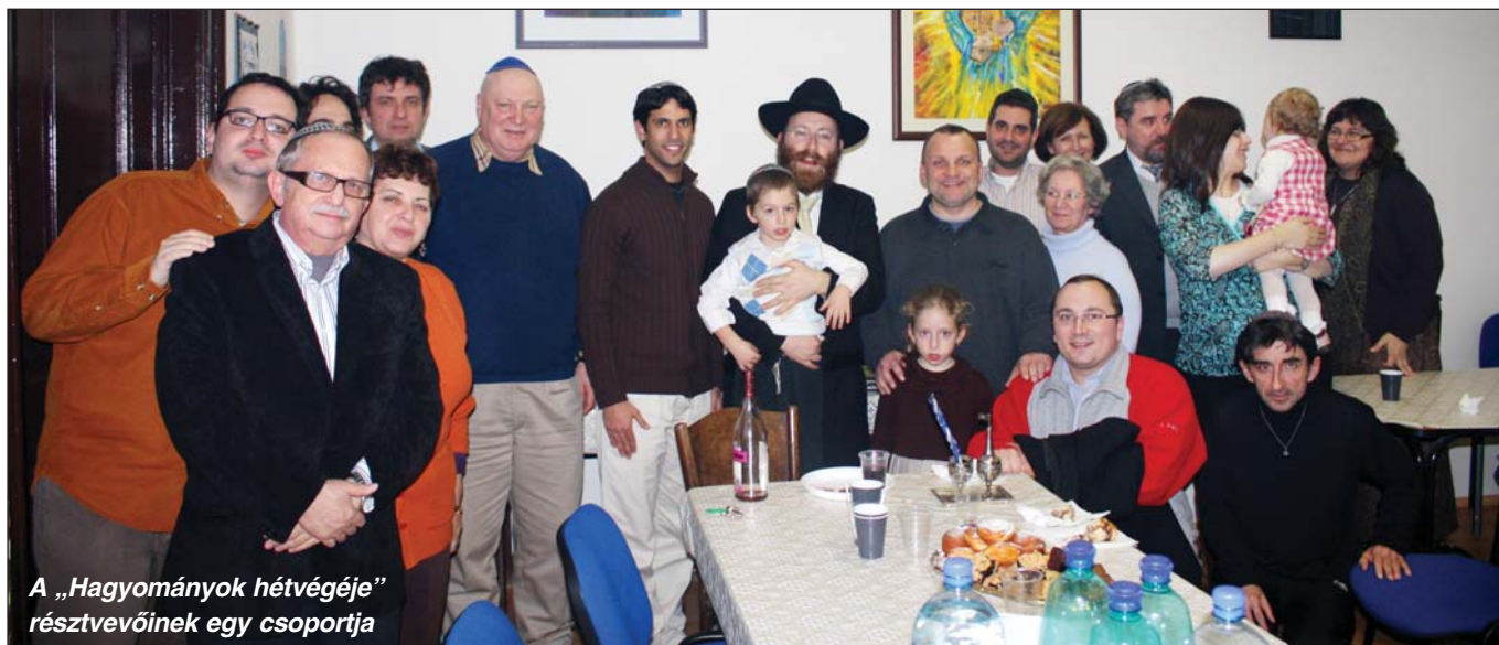
A „Hagyományok hétvégéje” résztvevőinek egy csoportja