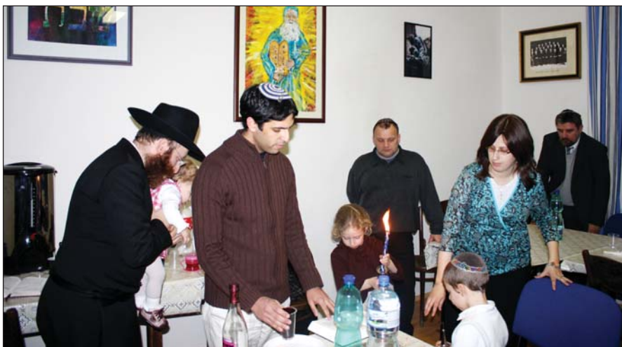
Havdala a Menházban. Az eseményről bővebben lapunk 3. oldalán olvashatnak.