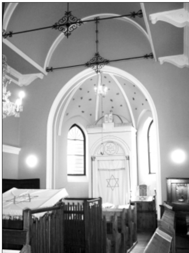
A felújított zsinagóga 2006 októberében