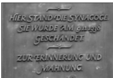
A zsinagógára emlékeztető tábla a német kisváros központjában

Az első szabad vasárnapomon felkerestem hát az emléktáblát, mely egy lakóház oldalán található, mint az a helyszínen készített fényképen is látszik. Azt gondoltam, bizonyára ennyi, amivel a város mai lakossága a helyi zsidó közösségre emlékezik, de szerencsére tévedtem. Néhány utcával odébb a gimnázium és az új városháza mellett egy embermagasságú