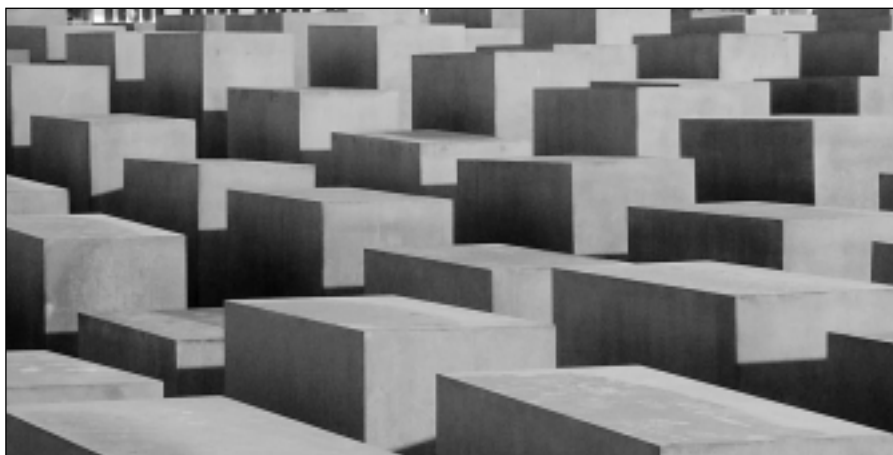
Az új berlini Holokauszt emlékmű a Brandenburgi kapu közelében

Holokauszt emlékmű található. A két márvány félkört egy-egy emberi alak szakítja félbe, a ez emlékmű mindkét oldalán az elpusztított zsidó polgárok neve, születési dátuma és helye látható... Megható, hogy egy ilyen kis városban ilyen módon adóznak egy elpusztított közösség emlékének.