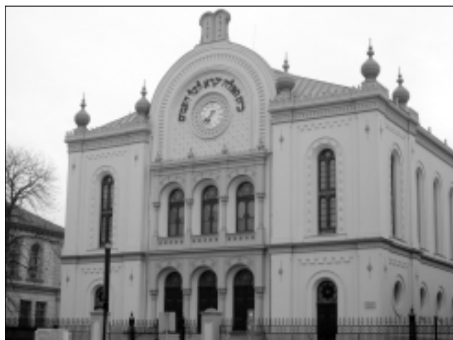
A pécsi zsinagóga