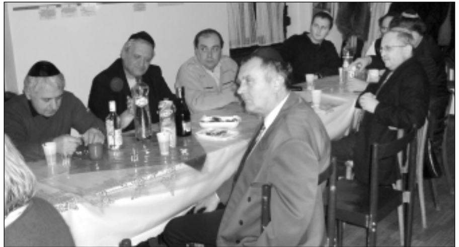
Chanukai ünnepség Érsekújvárott