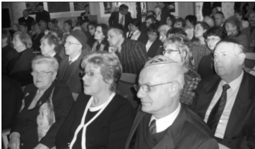
Ünnep a felújított Győri nagyzsinagógában

A programon a helyi közösség tagjai mellett, számos szimpatizáns, és a régió kiléinek tagjai - Mosonmagyaróvárról, Komáromból, Dunaszerda-