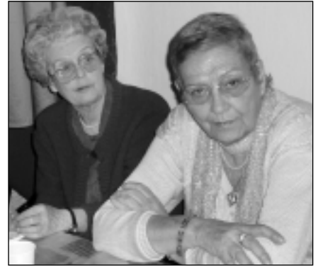
Törzstagok a Shalom klubban