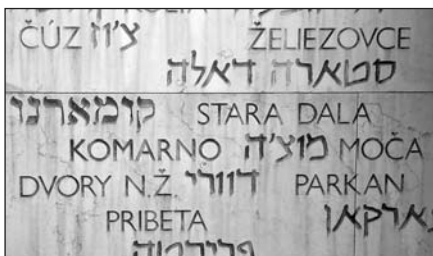
Komárom az Elpusztított Hitközségek völgyében