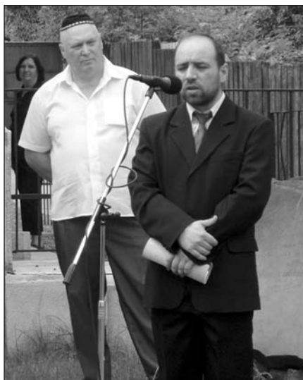
Megemlékezés a tatai zsinagóga kertjében