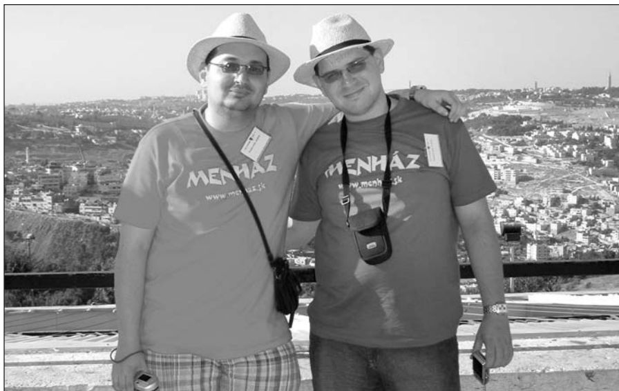
Izraelben is a Menházat képviseltük