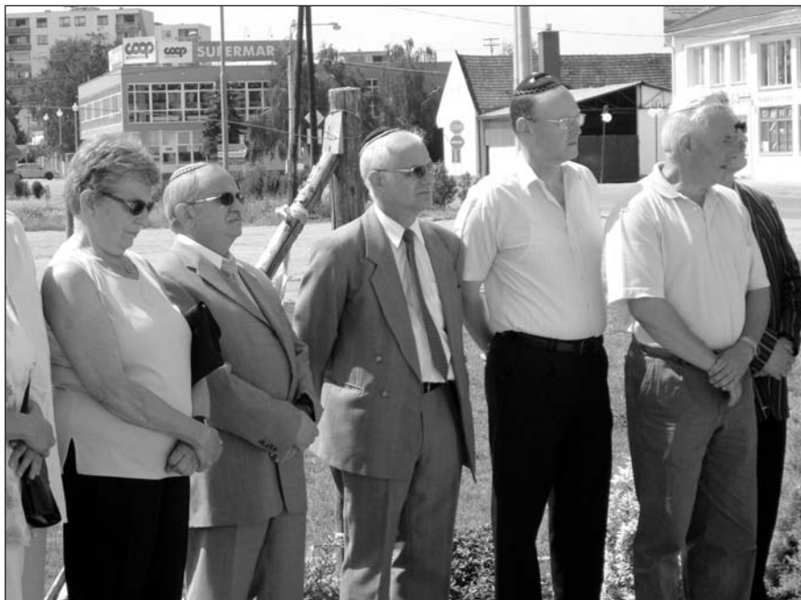
A régió hitközségeinek vezetői a nagymegyeri mártírnapon

Mi volt a bűnük, mit vétettek, hogy ilyen súlyos büntetés járt nekik? Mit