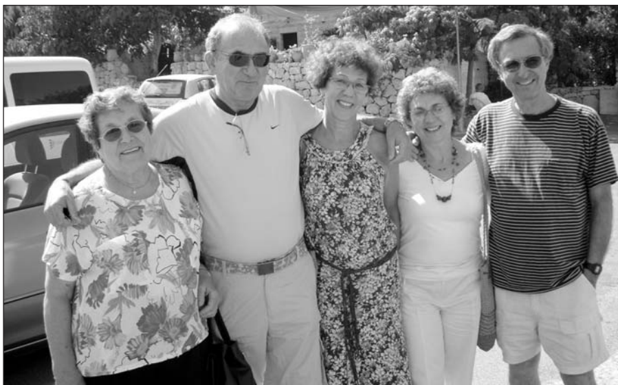
Találkozó a Vajnorsky családdal