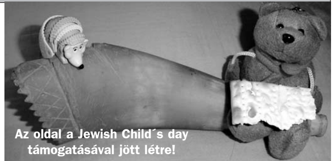
Az oldal a Jewish Child's day támogatásával jött létre!