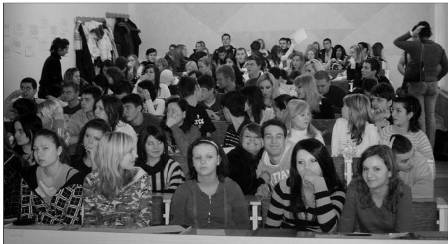
Interaktív órák a zsidóságról és a Holokausztról az Ozorákban