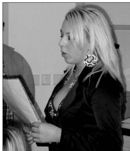
A diákok versekkel emlékeztek

A Holland Zsidó Humanitárius Alap (JHF) támogatásban részesítette a KZSH Kehila Regio (KehReg) programjának 3. évfolyamát. A 2006-ban indult sorozat részeként számos regionális eseményt szervezhettünk az elmúlt két évben. A 2008-ra érkező 7000 EUR- támogatás jelentős anyagi segítség közösségünknek, melyből újabb színvonalas rendezvény valósul meg. A programokról a HH hasábjain folyamatosan olvashatnak.