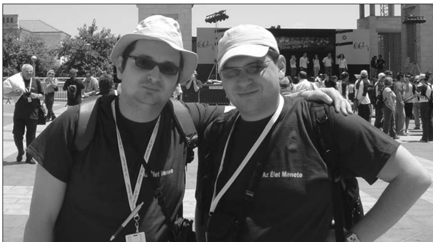
A Hitközségi Híradó szerkesztő Yom Haacmautkor Jeruzsálemben

autókon át a víztárolókig. Yom Haacmaut napját Jeruzsálemben töltöttük. Rövid buszos városnézés után a polgármesteri hivatalnál felállított hatalmas színpad előtt találkoztunk a többi csoporttal. Az ünnepi műsorban ismert zeneszámok, táncok köszöntötték az