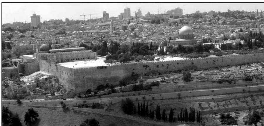
Helyszíni riport a 60 éves Izraelből. Írásunk a 7. oldalon.