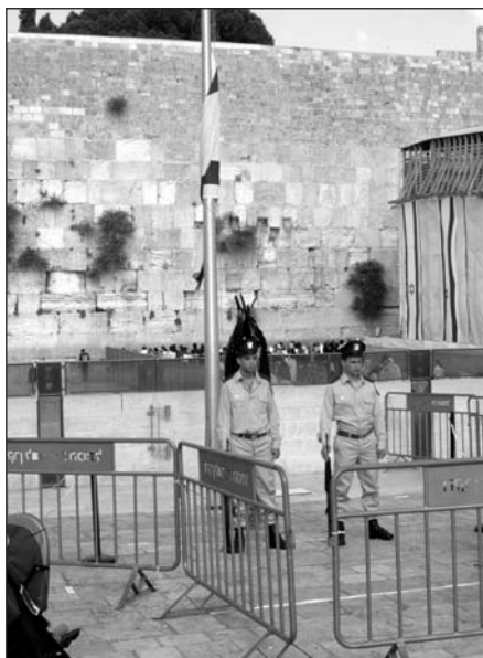
Yom Hazikaron emlékezés a Siratófalnál

Bármerre is jártunk az országban, minden kék-fehérbe volt öltöztetve, a Tel-Aviv-i toronyházaktól a személy-