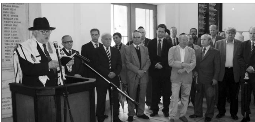
Június második vasárnapján ismét emlékezni gyűltünk össze a komáromi zsidó temetőbe. Írásunk a 6. oldalon.