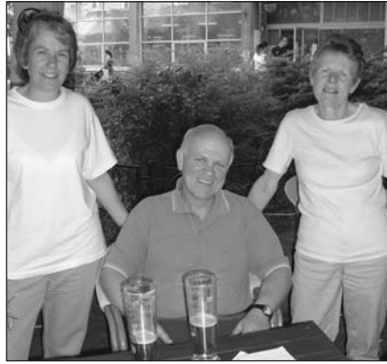
A Davis család Angliából gyökereit kutatta