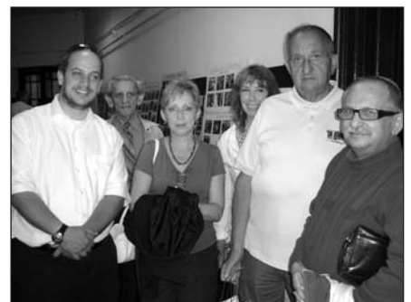
Budapesti vendégeink a Menházban