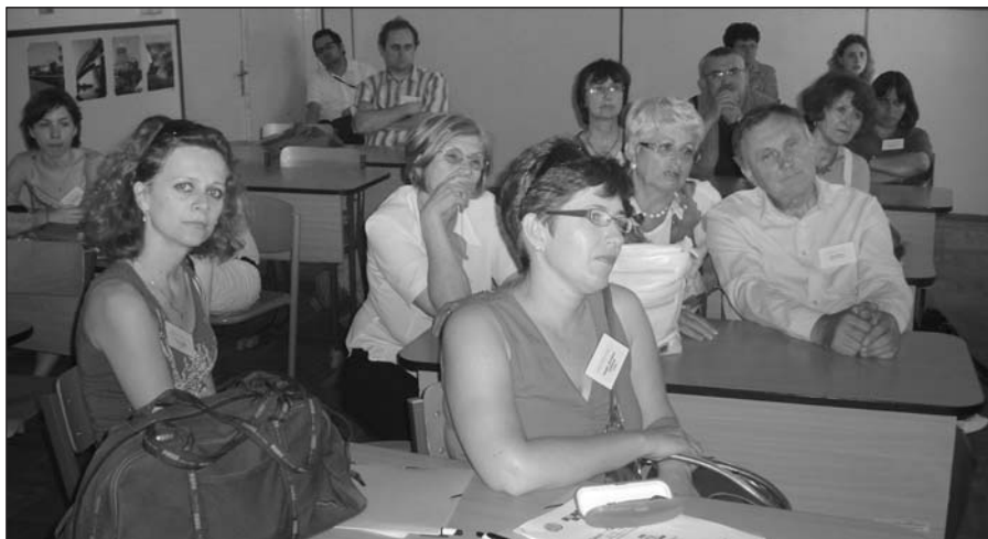
Látogatás a komáromi Jókai Mór Gimnáziumban