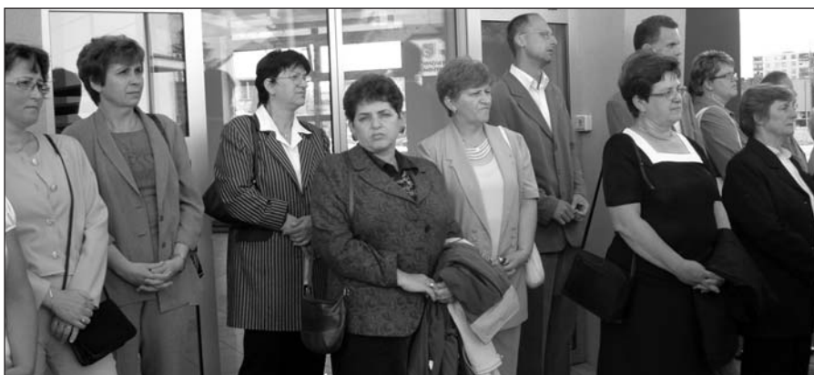
A 418 megyeri áldozatra emlékezők...