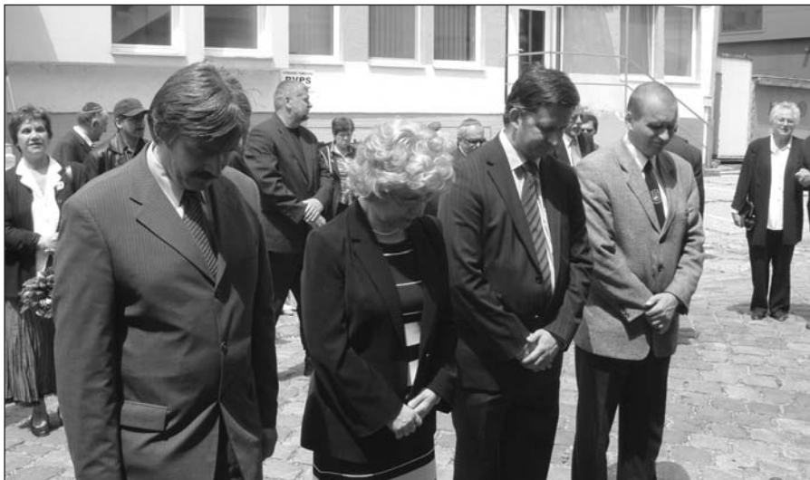
Komárom város vezetői fejet hajtának a zsinagóga falán 2006-ban felavatott Holokauszt emléktáblánál