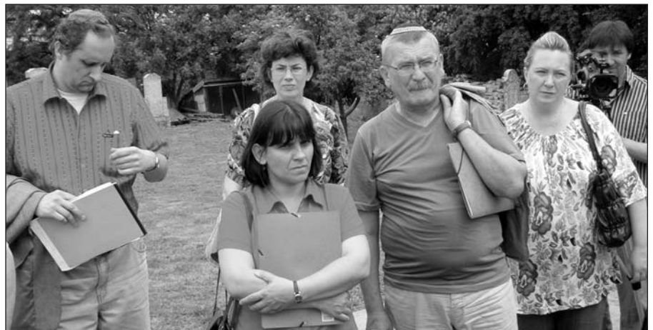
Látogatás a helyi zsidó temetőben