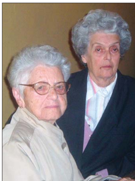
Az idősek közül csak néhányan tudtak eljönni...

hezebb feladat volt, de mégis sikerült. A csodák közt tarthatjuk számon, hogy az idei Nagyünnepek öt komáromi imaalkalmából négyszer minjeben