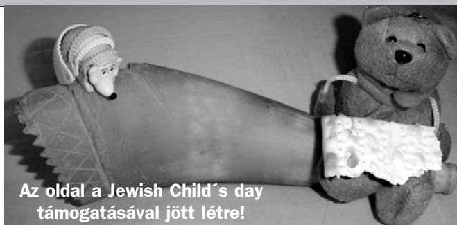
Az oldal a Jewish Child's day támogatásával jött létre!

A közös szombatköszöntés, mely gyakran még ma is a táborozók első meghatározó zsidó élménye, péntek reggel az