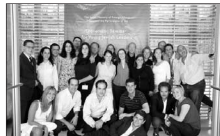
Zsidó fiatalok a világ minden pontjáról Jeruzsálemben