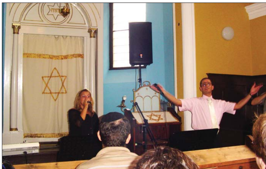
A Golda Meir Szalonzenekar nagy sikert aratott