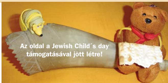
Az oldal a Jewish Child's day támogatásával jött létre!