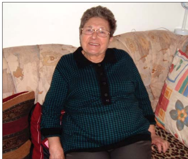
Teri néninél Jeruzsálemben