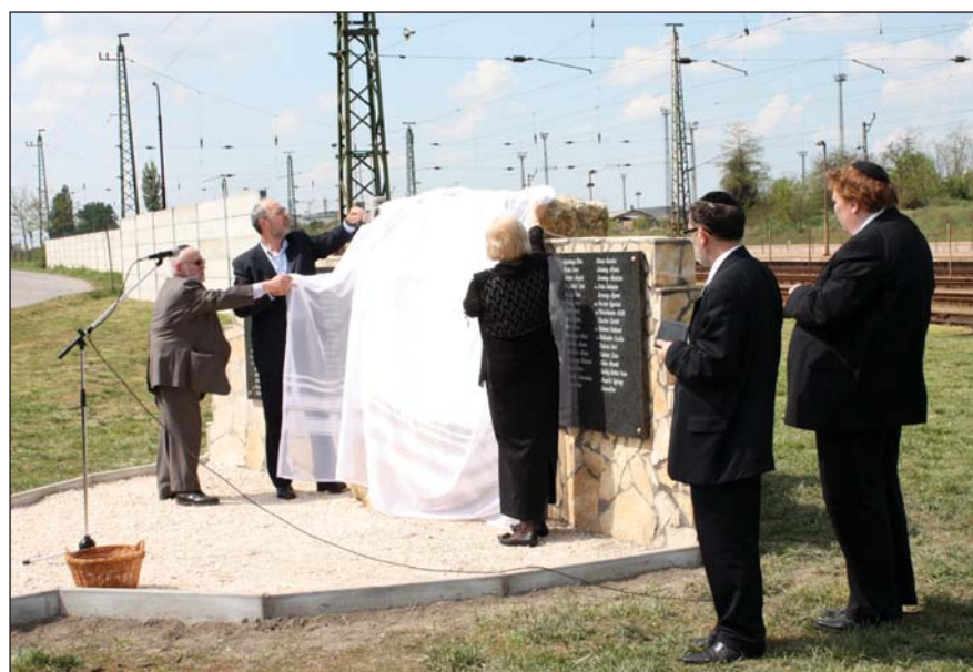
Április 19-én Holokauszt Emlékművet avattak Ácson. Szöveges beszámolóinkat májusi számunkban olvashatják.