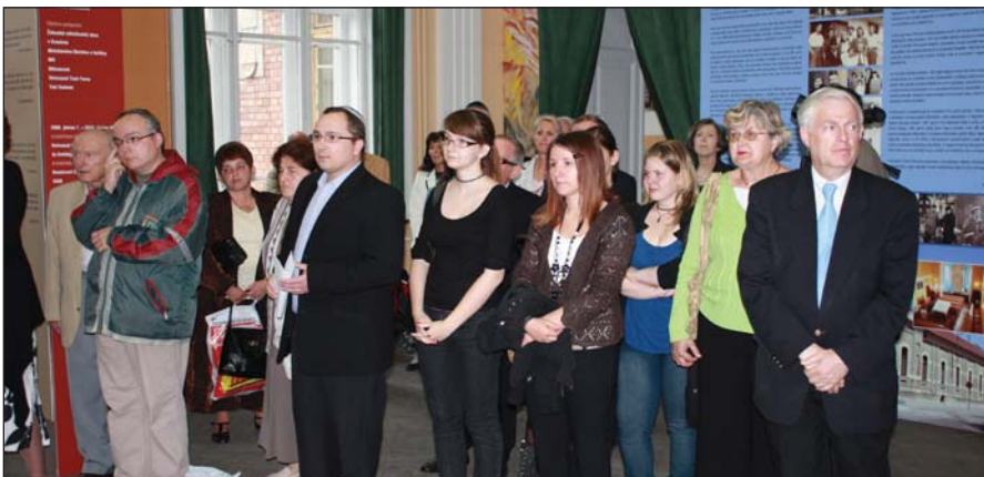
Emlékezők az Auschwitz Album-tárlat megnyitóján. Cikkünk az 5. oldalon.