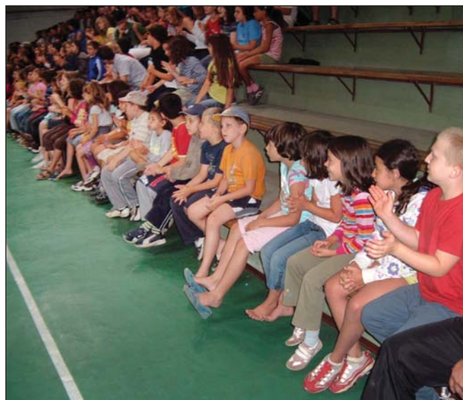
Gyerekek az idei második turnus Negev korcsoportjából

Akik 2000-ben 7-8 évesek voltak, ma 17-18 évesek.