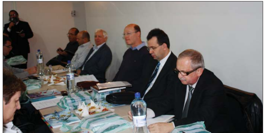
Hitközségi vezetők tanácskozás közben