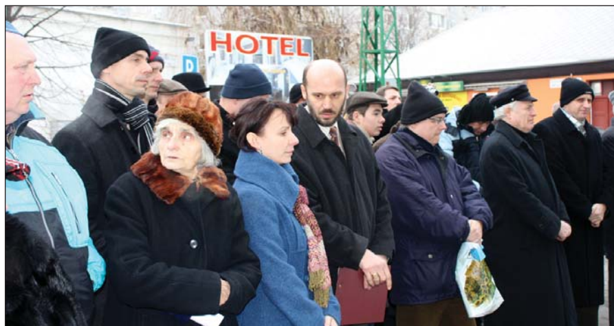
Emlékezők az egykori neológ zsinagógánál...