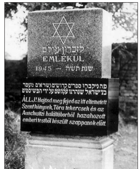
Az 1945-ben szimbolikusan eltemetett dunaszerdahelyi áldozatok emlékműve a zsidó temetőben (a kötet 108. oldalán)