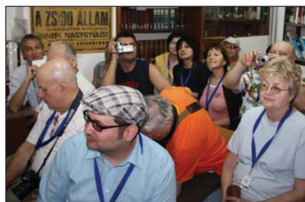
Látogatás a cfáti múzeumban