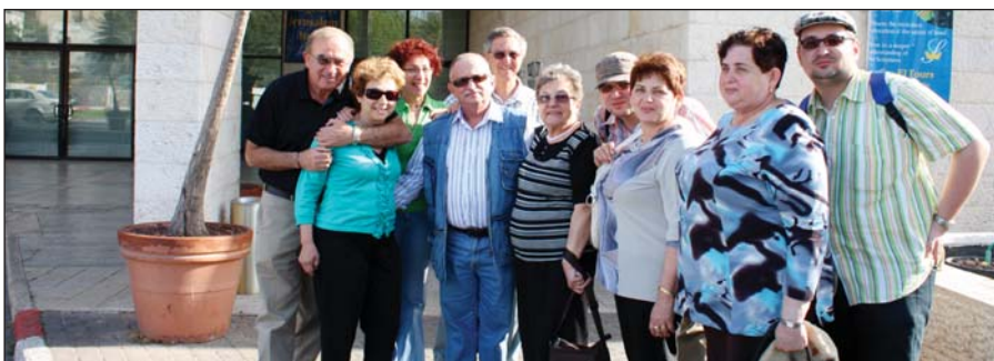
A Vajnorsky családdal Jeruzsálemben...