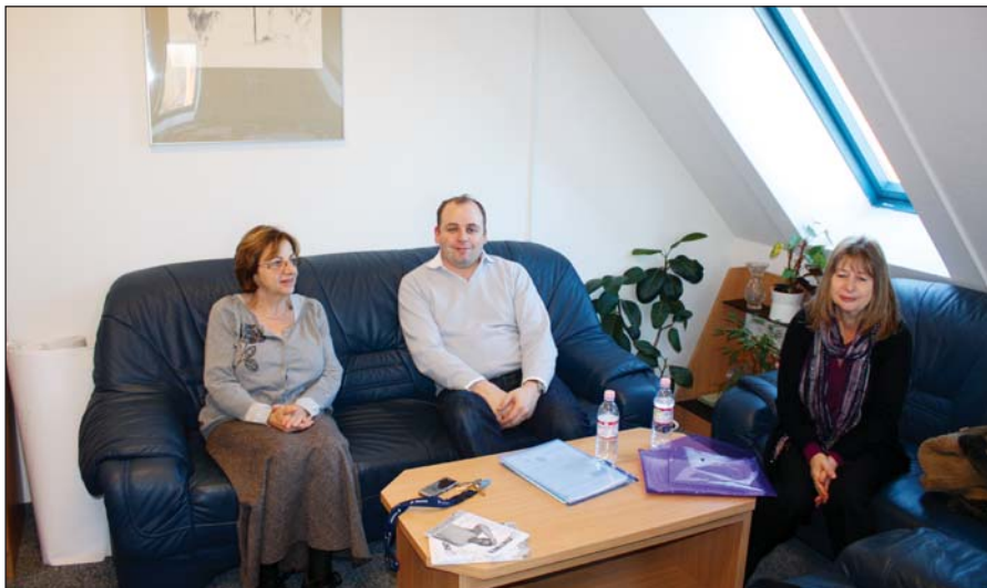
A Budapesti Zsidó Hitközség Scheiber Sándor Gimnázium és Általános iskolájában

1300 kilométer után a bécsi reptéren ért véget háromnapos utazásunk a zsidó gyermekek és fiatalok nyomában. Vendégeink a helyszínen kaphattak képet a jelenlegi helyzetről, ígértek szerint hamarosan visszatérnek a térségbe és felkeresik azokat a helyeket is, amelyekre most idő hiányában nem kerülhetett sor.