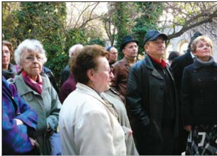
Komáromi és kassai résztvevők a kiránduláson