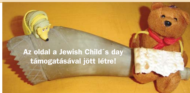
Az oldal a Jewish Child's day támogatásával jött létre!

Csütörtökön a hivatalos megnyitó keretében Ariel Muzicant, a Bécsi Zsidó Hitközség elnöke üdvözölte a résztvevőket az osztrák fővárosban, majd Aviv Shir-On Izrael Állam bécsi