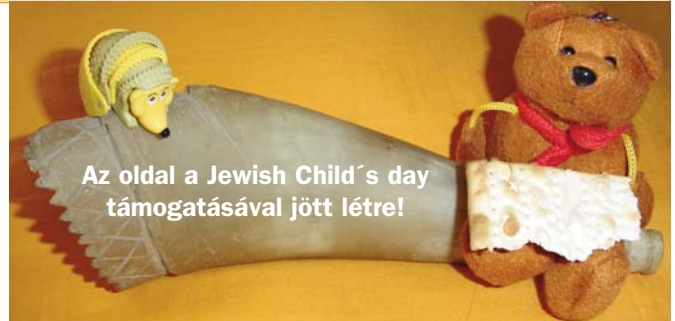
Az oldal a Jewish Child's day támogatásával jött létre!

és ötletes múzeumpedagógia elemeket felvonultató tárlatát sem. Rengeteg tudással gazdagodva köszöntünk el a 2012-es nyári olimpia helyszínétől... rohamléptekben elindulva a nyári táborozásig vezető úton.