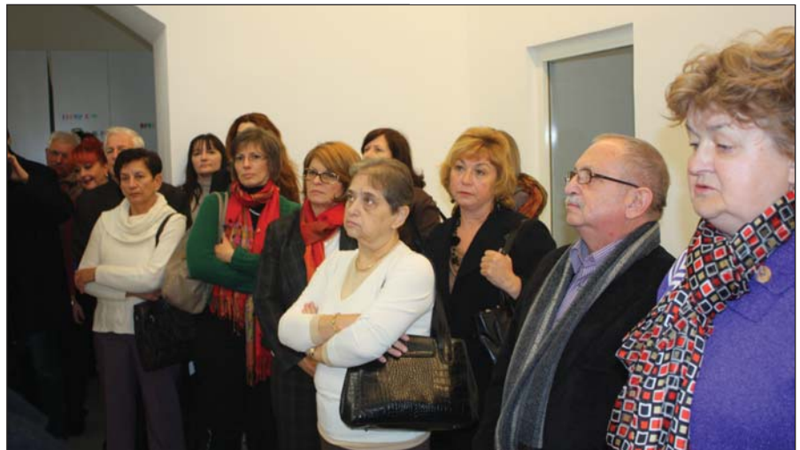
Látogatóban a levéltárban