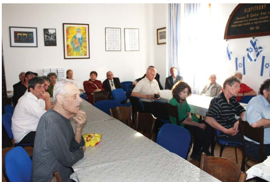
Filmvetítés a Wallenstein Zoltán teremben