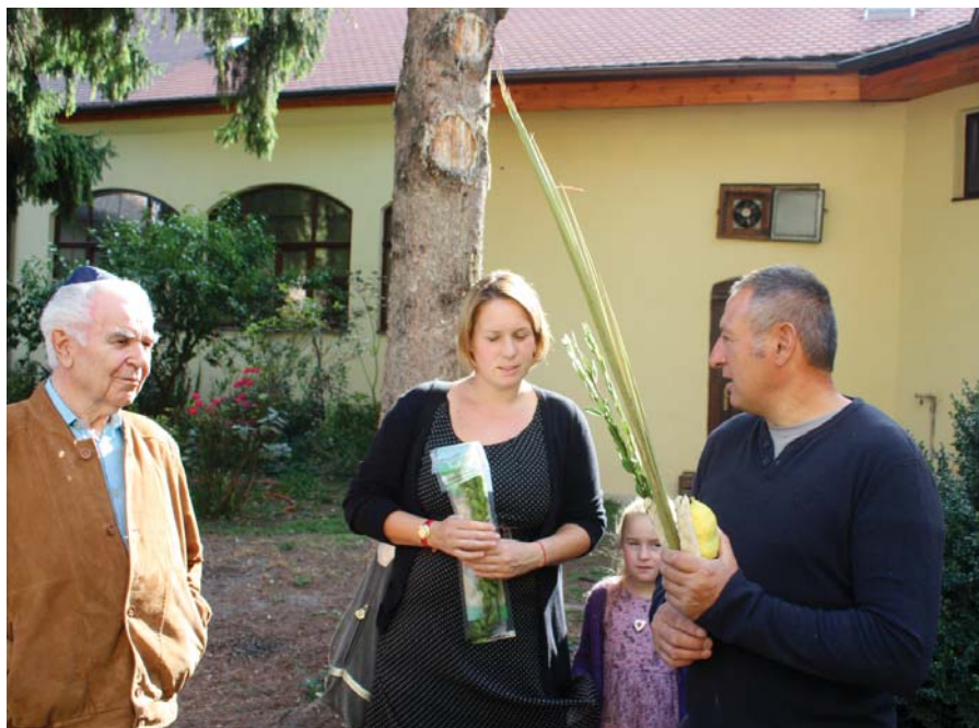
Klub Šalom v priebehu sviatku stánkov – Sukotu. Náš článok čítajte na strane 3.