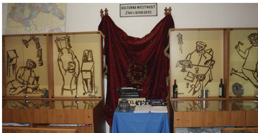
A Schnitzer Ármin Mikromúzeum felhívított kiállítása