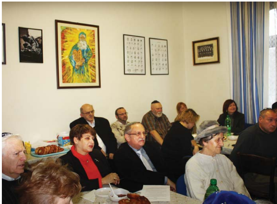
Článok na strane 3.