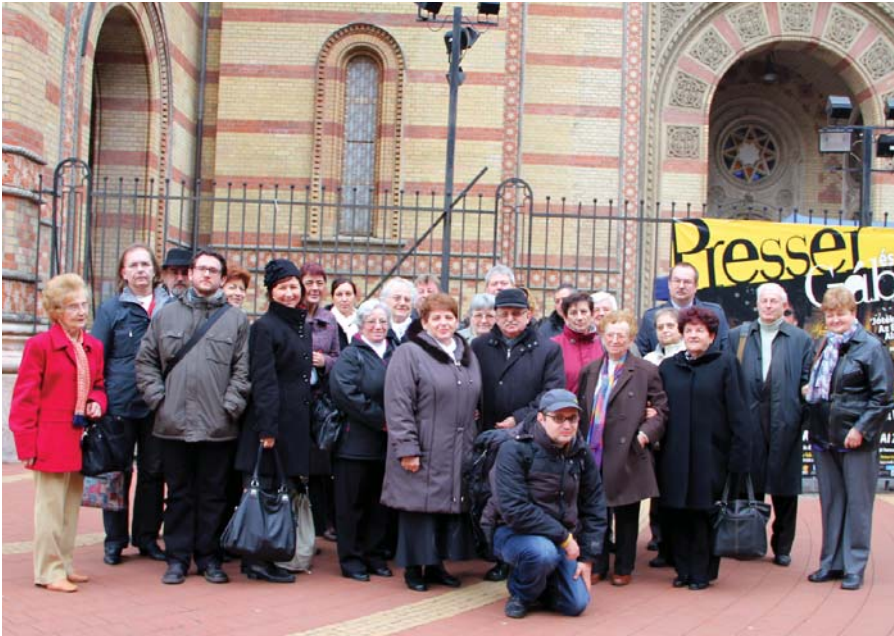
A budapesti kirándulásról szóló cikkünket lapunk 4. oldalán olvashatják.