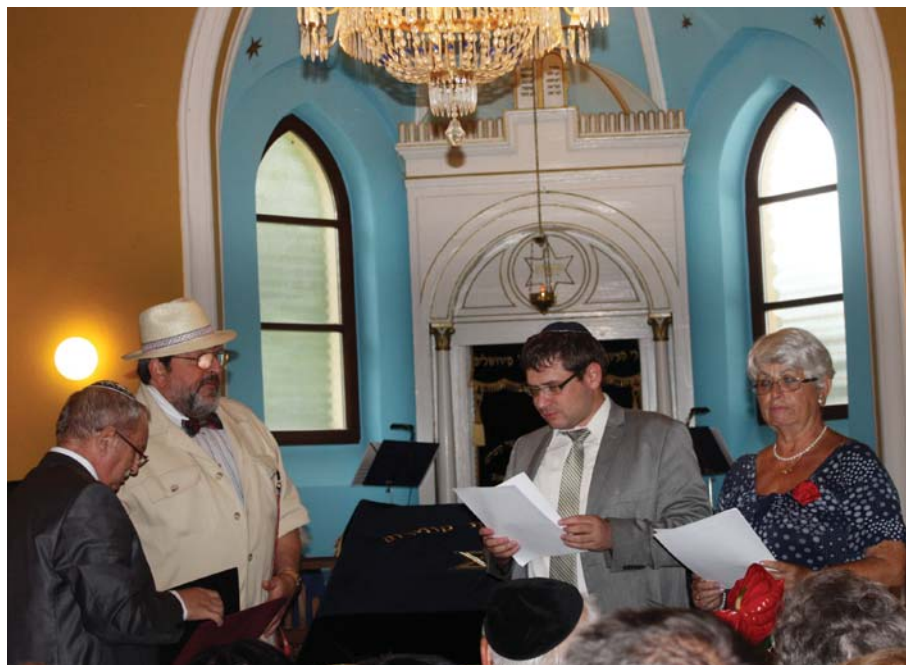
Náš článok na strane 4.