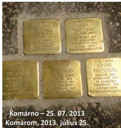
Komárno – 25. 07. 2013 Komárom, 2013. július 25.

A világot járva gyakran megkérdezik az embert, honnan jött. Nem szoktam ezen a kérdésen gondolkodni, automatikusan jön a válasz: Komáromból. Bár lassan tizennégy éve élek Budapesten, az OTTHON, az mégis csak ott van valahol a Duna és a Vág összefolyásánál.