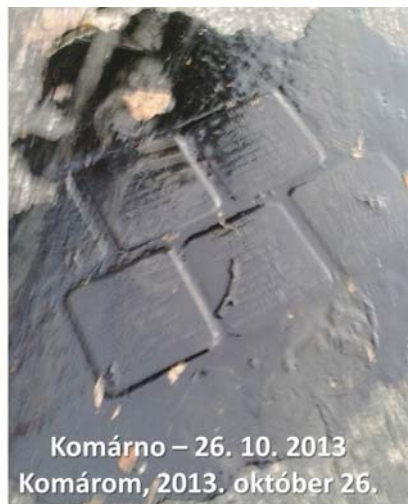
Komárno – 26. 10. 2013 Komárom, 2013. október 26.

Itt nőttem fel, idekötnek a csodálatos gyerekkor élményei. Itt jártam bölcsődébe, óvodába. Itt koptattam a Béke Utcai Alapiskola és a Selye János Gimnázium padjait.