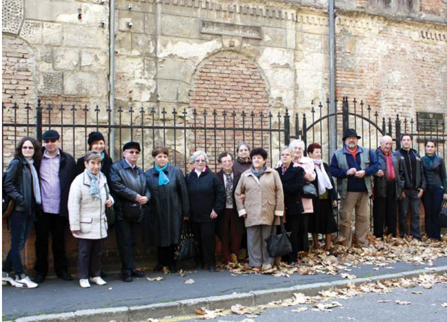
Beszámolónk a kirándulásról lapunk 3. oldalán olvasható