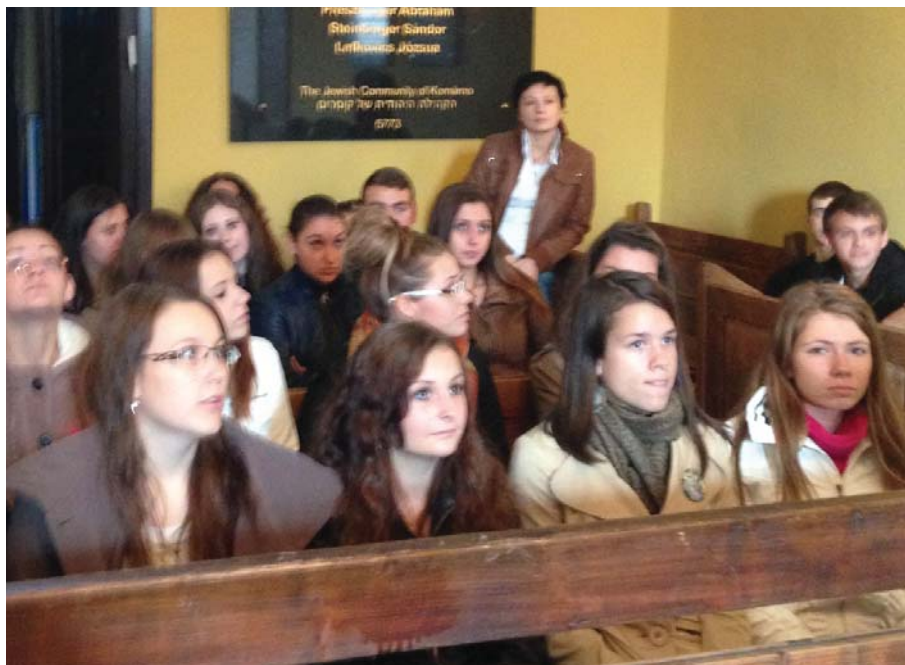
Menház navštívili študenti z Veľkého Medera. Náš článok na strane 3.