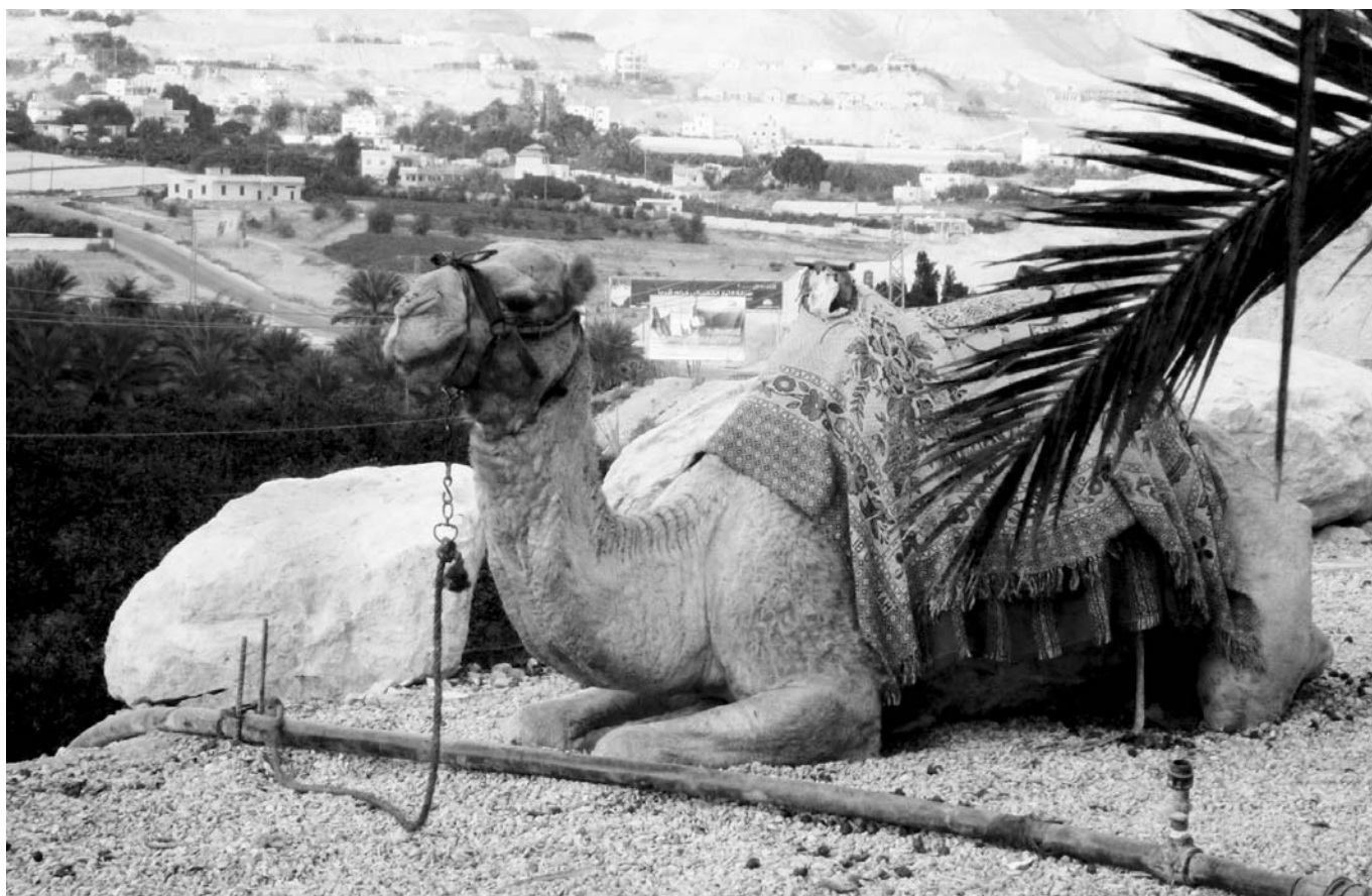
A decemberi Hitközségi Híradó oldalait Berényi Szilvia (Budapest) felvételei illusztrálják, a fotósorozat címe: Szentföld fekete-fehérben