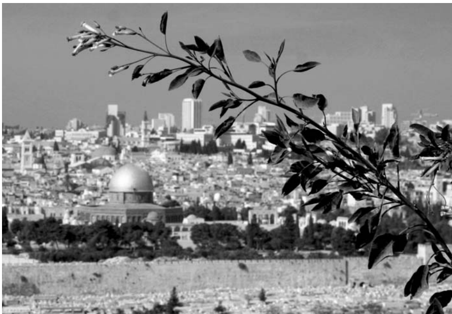
A decemberi Hitközségi Híradó oldalait Berényi Szilvia (Budapest) felvételei illusztrálják, a fotósorozat címe: Szentföld fekete-fehérben