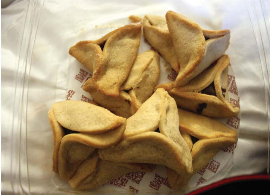
Purim – 2014. március 16.