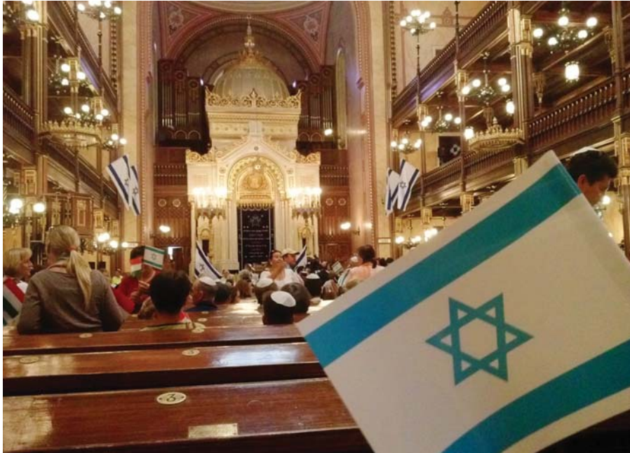
Israel mellett kiálló békés tüntetőkkel telt meg a budapesti Dohány zsinagóga