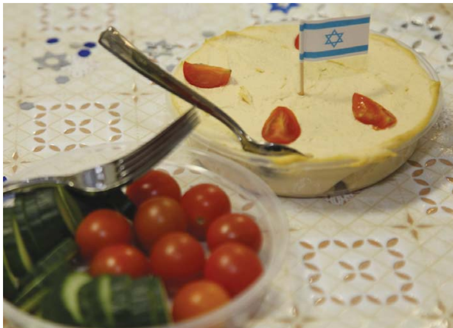
Izraelről a Shalom klubban, részletek a 3. oldalon