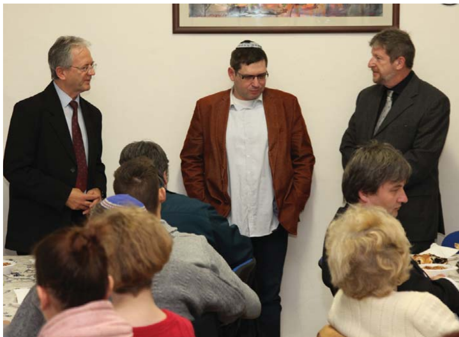
Klub Šalom s veľvyslancom Izraela (strana 3.)