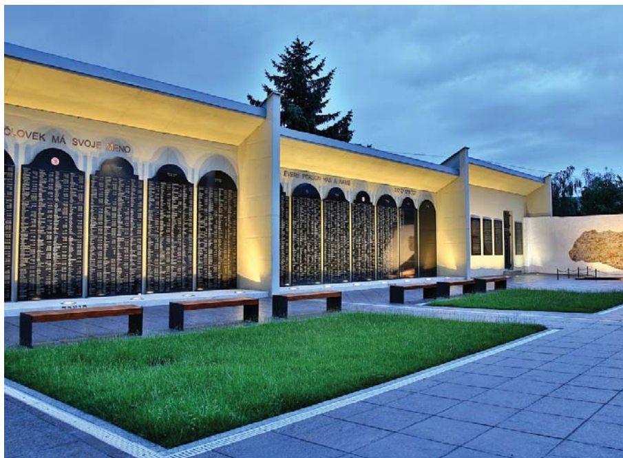
V Bardejove pribudol nový pamätník holokaustu (strana 3.)