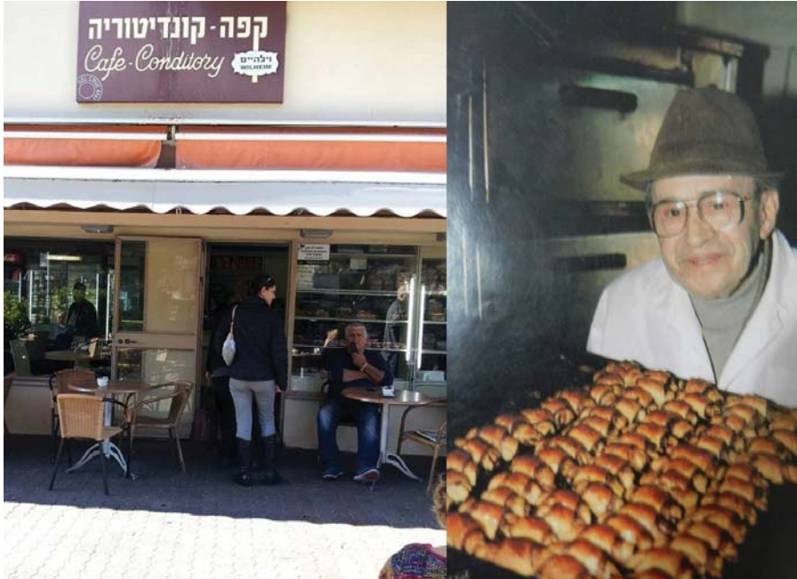
Sorozatunk első részében az izraeli Wilhelm cukrászda történetét mutatjuk be (3. oldal)