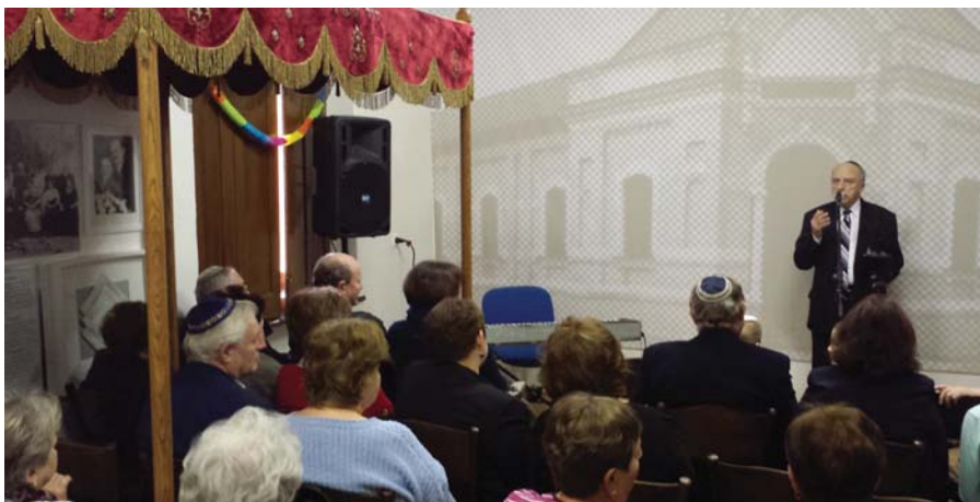
Purim 5775 Komáromban – bővebben márciusi számunkban