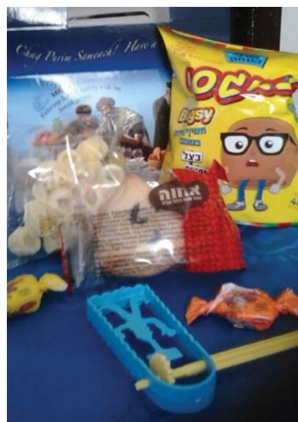
Purim 5775 – šlachmones od ÚZZNO