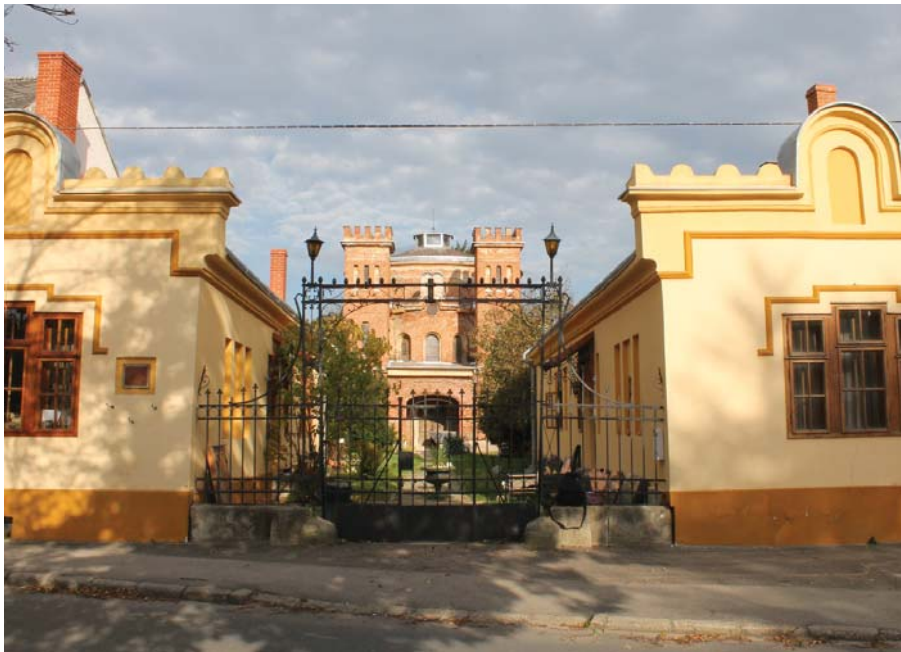
Hitközség alakult Kőszegen (részletek a 4. oldalon)