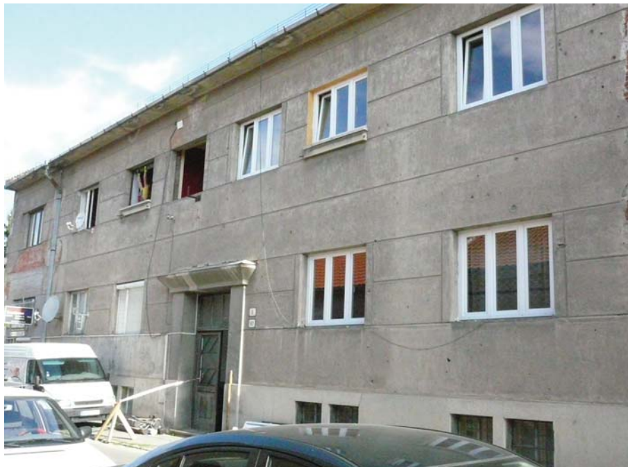
Staré okná nahradili novými (strana 2.)