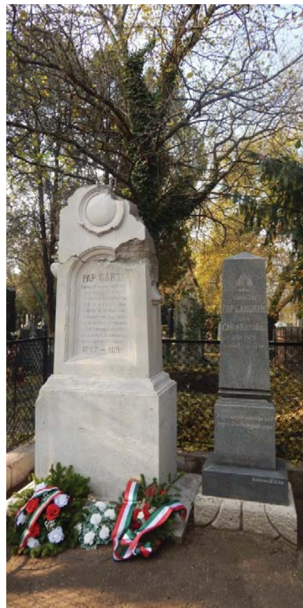
Pap Gábor felújított sírköve

lelkipásztor, kiváló hazafi távozott az élők sorából. Ahogy az egész város megmozdult a szeretett lelkész meghívása, beiktatása kapcsán, úgy az utolsó útjára is elkísérte őt a város lakossága. Temetésén a Komáromi Zsidó Hitközség testületileg vett részt, amint arra a közgyűlési jegyzőkönyvében található – 1895. november 3-i határozat is utal. A templomi gyászünnepély és a temetési menet zavartalanlanságát a komáromi szekeresgazdák bandériuma biztosította. A város énekkarai gyászenéket énekelve kísérték a menetet. Síremlékét a komáromi gyülekezet állíttatta fel, mely 1945. januárjában a város bombázásakor megsérült, és 2015 októberében a komáromi református gyülekezet felújíttatta.