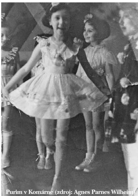
Purim v Komárne