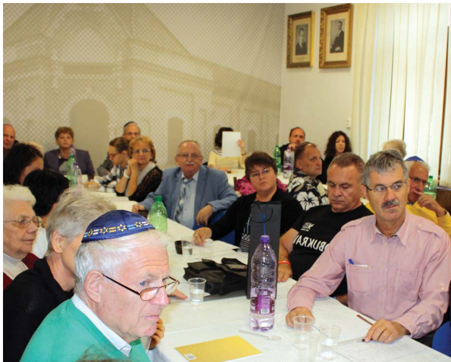
A Diaszpóra színes világának nyomában (beszámolónk a 3. oldalon)