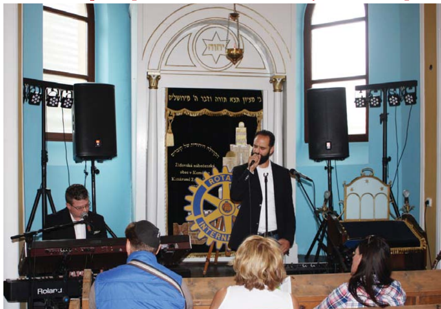
Koncert skupiny Docpiano Band (strana 3.)