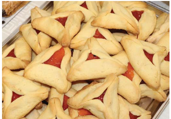
Purimi Hámán füle

Purimi szokás Slách Moneszt, édességekkel teli tálakat küldeni rokonoknak, barátoknak. Vannak családok, akiknél összegyűlik 8-10 édességgel teli tál. Sokan már megunták, ezért más küldenek például: házilag készített szendvicstálat, sós süteményeket, hozzá sört vagy bort, kreatív gyümölcstálat, mozijegyet pattogatott kukoricával, ajándékkártyát pizzára, falafelre vagy egy kiválasztott kávéházba. Akár mit, ami ellenkezik a sok édességgel teli tállal.